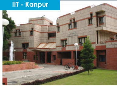
IIT - Kanpur