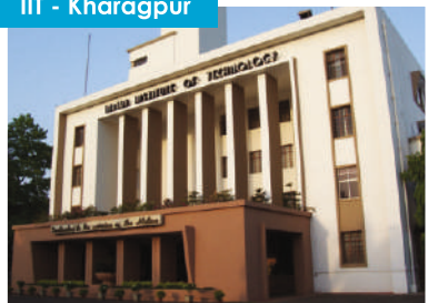
IIT - Kharagpur