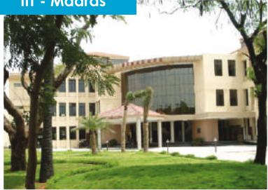
IIT - Madras