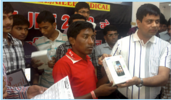
IIT की परीक्षा में सफल छात्रों को Mobile प्रदान करते हुए J. Roy Sir