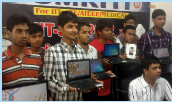
IIT की परीक्षा में सफल छात्रों को Lap-top प्रदान करते हुए J. Roy Sir