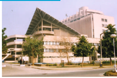
IIT - Delhi