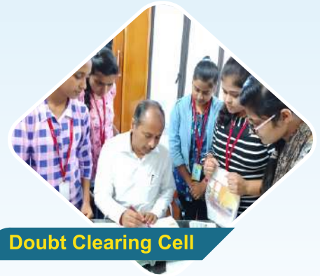
Doubt Clearing Cell