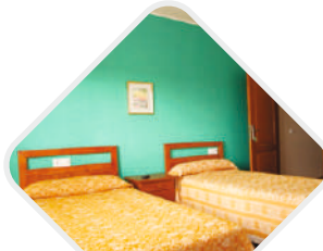
OUR HOSTEL FACILITY