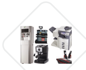
SOME OTHER FACILITY