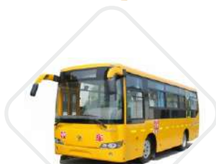
OUR TRANSPORT FACILITY